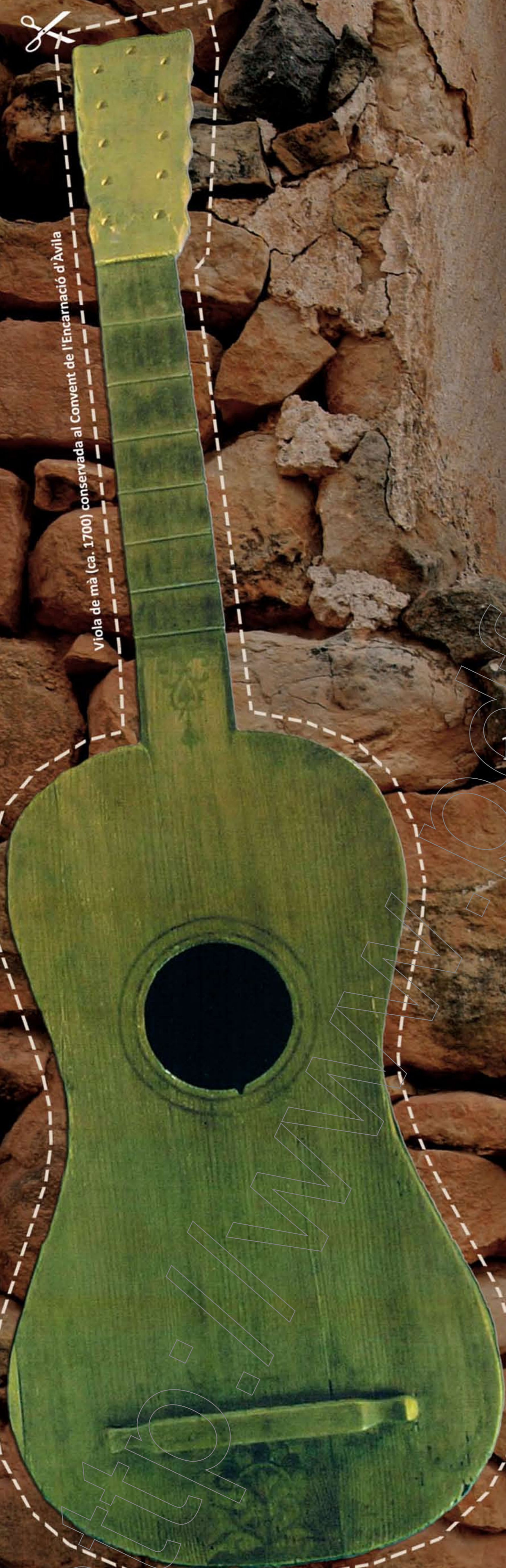
Viola de mà (ca. 1700) conservada al Convent de l'Encarnació d'Àvila

Ds. JUNEDA 14 set. | Mas Miravall 21.00 h | JAUME TORRENT